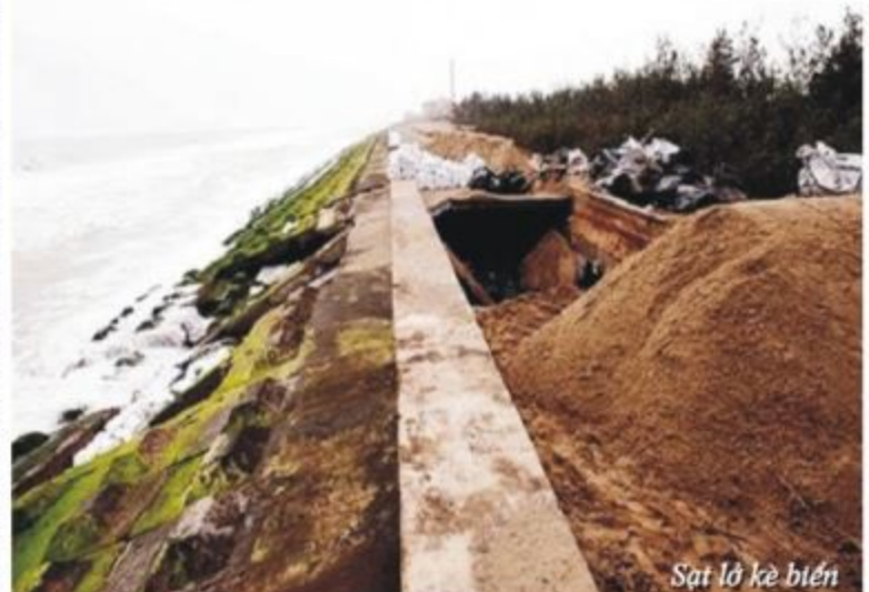
Sạt lở bờ biển