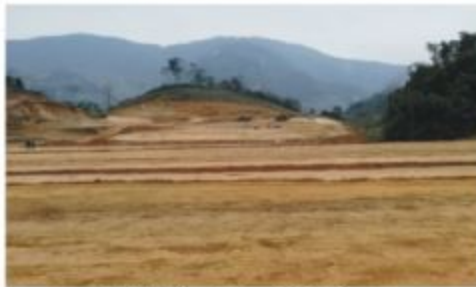
Mật bằng khu tái định cư đang được thi công tại Sơn La

Mục đích của chuyến đi kiểm tra khu vực người dân đang ở nhờ hoặc ở tạm, nơi bị sạt lở đất, lũ quét làm mất nhà cửa; đánh giá nơi dự kiến mật bằng di dời tái định cư cho các hộ dân. Kết thúc, đoàn kiến nghị: địa phương tiếp tục chăm lo hỗ trợ nhân dân bị thiệt hại sớm ổn định đời sống, đặc biệt trong dịp Tết 2018; theo dõi chặt chẽ diễn biến sạt lở, cắm mốc giới cảnh báo ở những vị trí có sạt lở, nguy hiểm; kiến nghị các Bộ, ngành, đoàn công tác thống nhất kiến nghị BCD TW và PCTT, Bộ Tài chính, Bộ KHĐT, Bộ TNMT sớm trình Thủ tướng Chính phủ hỗ trợ kinh phí để địa phương triển khai di dời dân khẩn cấp cho những hộ gia đình bị mất nhà cửa hiện đang phải ở nhà tạm, xen ghép... đến nơi an toàn.