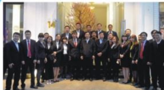
Bộ trưởng Nguyễn Xuân Cường chụp ảnh lưu niệm với cán bộ phóng viên Báo Nông nghiệp Việt Nam