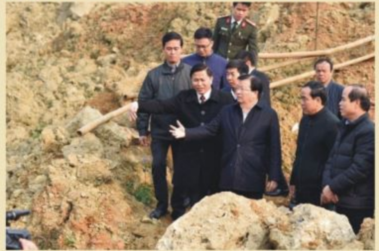
Phó Thủ tướng Trịnh Đình Dũng thị sát khu vực sạt lở tại xóm Khanh, xã Phú Cường, huyện Tân Lạc