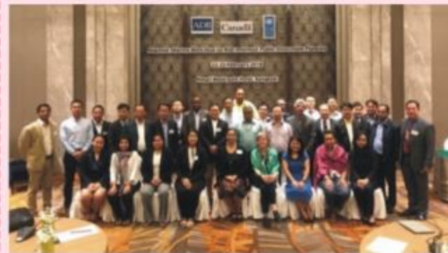
Các đại biểu chụp ảnh lưu niệm tại Hội thảo