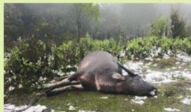
Trâu bị chết vì giá rét