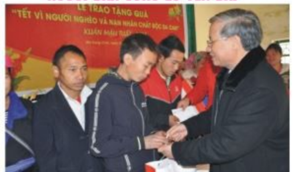
Đồng chí Trần Quốc Vương tặng quà đồng bào bị ảnh hưởng thiên tai tại Yên Bái

Nhân dịp Tết Nguyên đán Mậu Tuất 2018, đồng chí Trần Quốc Vương, Ủy viên Bộ Chính trị, Thành viên Thường trực Ban Bí thư, Chủ nhiệm Ủy ban Kiểm tra T.Ư đến thăm, chúc Tết và tặng quà các hộ gia đình nghèo, hộ bị ảnh hưởng do thiên tai trên địa bàn tỉnh Yên Bái trong chương trình trao quà "Tết vì người nghèo và nạn nhân chất độc da cam" do Hội Chữ thập đỏ Việt Nam tổ chức vào ngày 9/2 vừa qua.