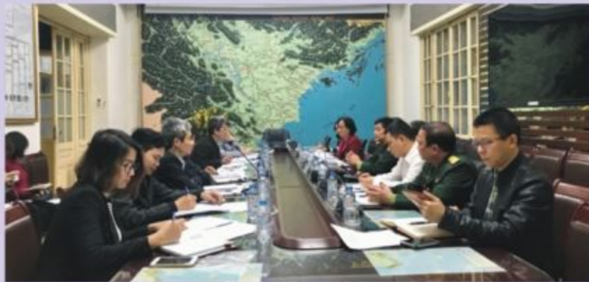
Toàn cảnh cuộc họp

Nhằm thực hiện Quy chế phối hợp giữa Tổng cục Phòng, chống thiên tai (PCTT) và Cục Dân quân tự vệ trong hoạt động phòng, chống thiên tai ở cơ sở, sáng 27/2, Tổng cục PCTT đã có buổi làm việc với Cục Dân quân tự vệ về chương trình phối hợp công tác trong năm 2018.