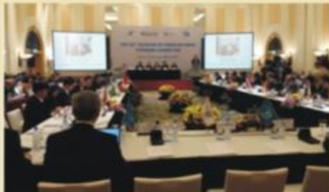
Toàn cảnh Khóa họp thường niên lần thứ 50 của Ủy ban Bảo quốc tế

Thiệt thành tựu chính của Ủy ban Bảo trong việc hỗ trợ, gắn kết các hoạt động các nước thành viên để phát triển công tác nghiên cứu các hiện tượng thời tiết cực đoan, giảm nhẹ rủi ro do thiên tai, phục vụ phát triển kinh tế xã hội trong khu vực nói riêng và trên thế giới nói chung.